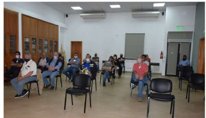
📷 Delegados presentes en el Salón Auditorio de la Cooperativa Eléctrica de Monte.